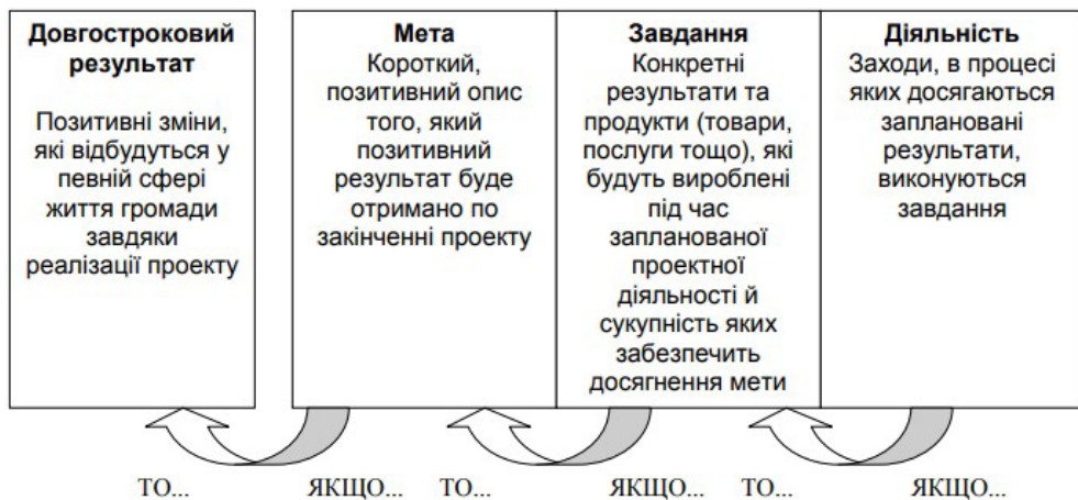
Рис. 2. Логіка побудови культурологічного проекту

Наступним етапом «життєвого циклу» проекту є його планування – створення переліку певних дій та порядок реалізації проекту. Тут поняття проекту поєднується з організаційними діями: діяльність співвідноситься з цілями проекту, робота з наявними ресурсами, умовами виконання, виконавцями та розміром фінансування.