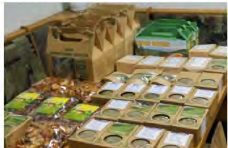
Рис. 7. Екологічна продукція торгової марки «Бескид»