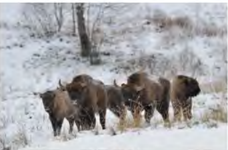
Рис. 6. Стадо зубрів у Національному парку «Сколівські Бескиди»