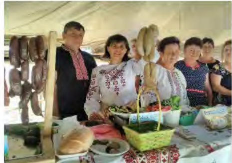
Рис. 5. Учасники кластеру «Бойківські газди» на Всесвітніх бойківських фестинах у місті Турка