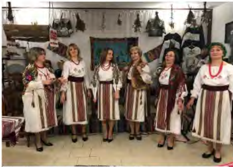
Рис. 4. Вечорниці у відпочинковому комплексі «Калина» в селі Тухля