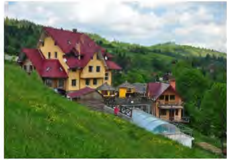
Рис. 3. Готельний комплекс «Швагри» у селі Орявчик