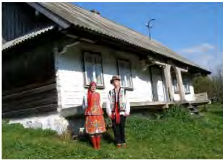
Рис. 2. Давня бойківська хата та її господарі

з виробниками традиційної і екологічної продукції, фольклорними ансамблями, природоохоронними та культурно-історичними установами, громадськими організаціями щодо створення нових продуктів та різного спектру послуг. Ця співпраця стала основою для організації кластеру сільського туризму як дієвого інструменту просування території на туристичному ринку. За результатами зборів, робочих зустрічей і консультацій пріоритетом було обрано забезпечення кластером розвитку атракцій і послуг, пов'язаних з краєзнавчо-етнографічними і екологічно-відпочинковими туристичними заняттями – локальний продукт кластеру. Цей кластер за спеціалізацією належить до нічліжно-гастрономічного (садибного) типу з еколого-етнографічним продуктом (рис. 2–7).